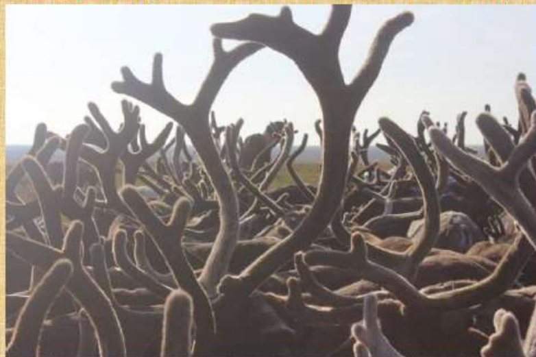
Мора - тулыссянь быдмö, небыд сюр