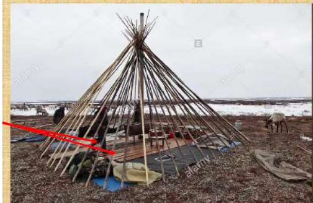
Лата - чом поскö пуктан пöвъяс