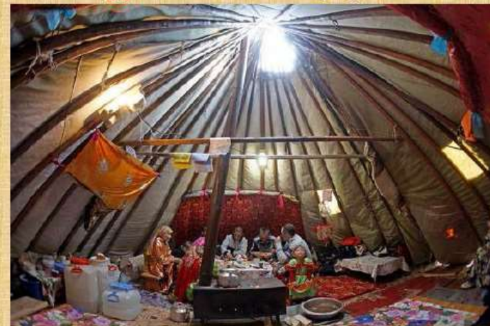
Мокота рузь - чом вылас форточка кодъ