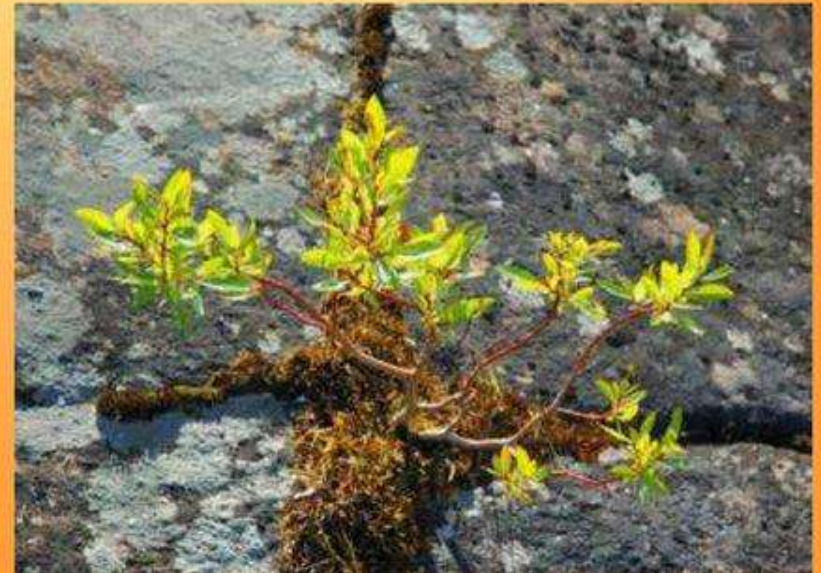
кустарниковая – на юге.