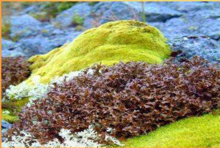
мохово-лишайниковая на севере,

Основу его образуют мхи и лишайники, на фоне которых развиваются низкорослые цветковые растения — травы, кустарнички и кустарники.