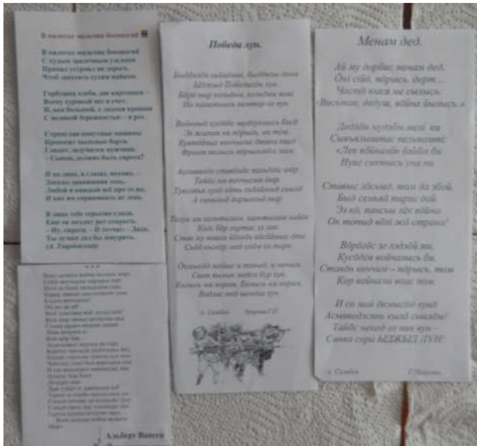
Стихотворения и песни о войне представлены на коми и на русском языках.