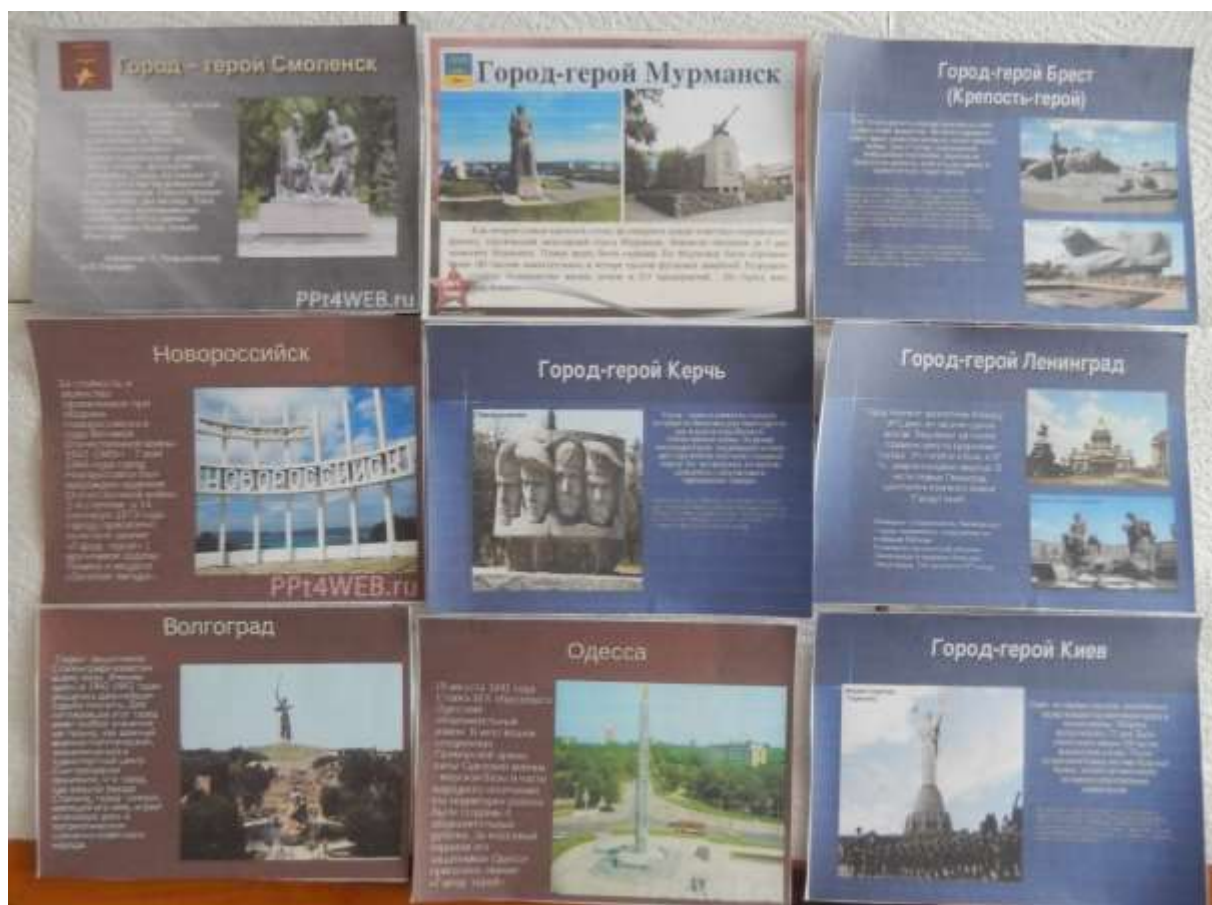
Карточки с городами-героями и описанием их вклада.